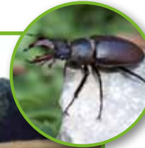
Layout: scriptus-ebrach.de Fotos und Illustrationen: Kathrin Michaelis, fotolia.com